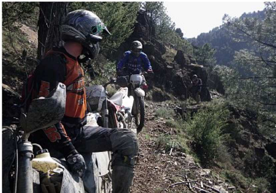
▲ Træningen var tilrettelagt med længere ture i området og decideret teknisk træning med danske instruktører, der bl.a. har deltaget i Six days Enduro. Turen var arrangeret med 2 hold, således, at både de mere øvede, som mindre øvede, fik tilrettelagt dagene tilpasset deres niveau. Målet med turen var at deltagerne efterfølgende skulle være bedre rustet til sommerens løb i ind- og udland.

V i var en gruppe på 12 forventningsfulde enduro drenge, med stor spændvidde i alder som erfaring, som i slutningen af april havde flyttet os selv og cyklerne ned til Sansepolcro i Toscana. Få dage før vores ankomst, havde det sneet, og et par steder på toppen af bjergene, kørte vi igennem snedriverne. I modsætning til den lange danske vinters frysende greb, var der her kun enkelte små klatrer tilbage, og der var ingen tvivl om, at foråret havde taget magten. Det er nu engang sjovere at fræse igennem sneen, når solen står højt på himlen, og det er 17-20°C i skyggen. Der var tale om en international samling enduro drenge, samlet ikke bare fra Danmark, men fra fjerne egne som USA og